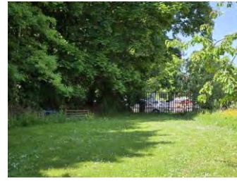
Zugang Feuerwehr von der Schwimmbadstraße

An den Gebäudestirnseiten sind jeweils Rettungsleitern angebracht, der Zugang zu diesen Notleitern erfolgt über die Balkone. Es ist sicherzustellen, dass die Rettungsleitern über die Balkone sicher und ungehindert erreicht und gefahrlos benutzt werden können.