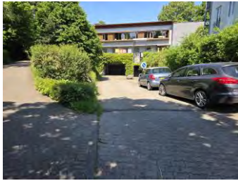
Zufahrt zur Tiefgarage

Im Außenbereich müssen die Flucht- und Rettungswege jederzeit begehbar sein (Im Winter Eis und Schnee frei). Die Anfahrtswege und die Aufstellflächen für die Feuerwehr sind unbedingt freizuhalten und dürfen nicht zugestellt oder zugestellt (Container, Material) sein.